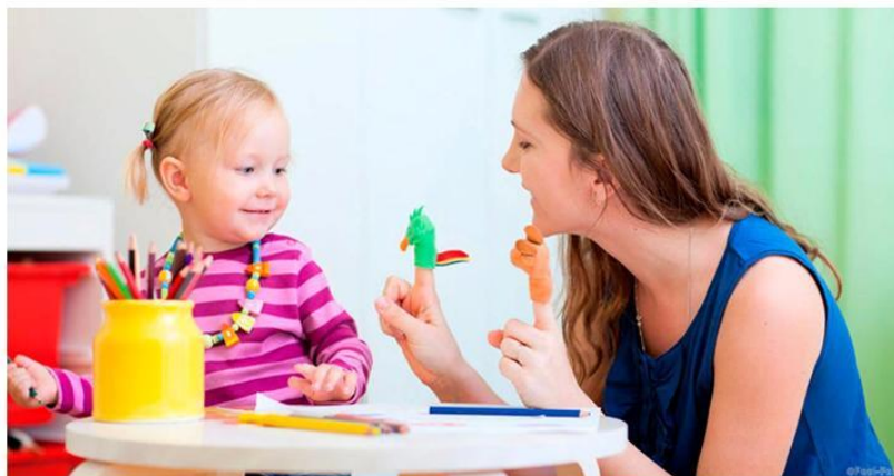
СОСТАВИТЕЛЬ: УЧИТЕЛЬ-ЛОГОПЕД СОСНОВСКИХ ВАЛЕНТИНА ВЛАДИМИРОВНА

Поэтому, необходимо посещать логопеда с целью консультирования по продвижению в речи ребёнка, строго выполнять все его указания. Никакая самая тщательная работа логопеда не исключает необходимости помогать дома детям правильно произносить те или иные звуки.